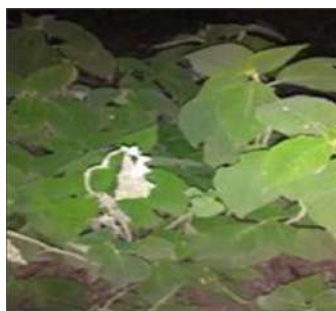
Foto 32, Planta medicinal

Sirve para dolor de oído, el dolor que da es como que está pinchando con algo en el oído, entonces uno ya se sabe que se puede preparar esta medicina para la curación.