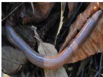
Foto 68, Lombriz

Si se encuentra una lombriz negro pintado, es que va morir alguien de la familia.