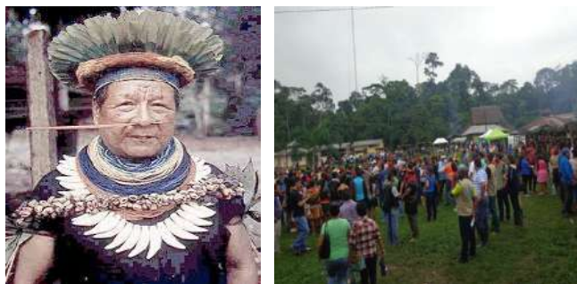
Foto 45, Fiesta de la comunidad

realizan y demuestra dentro y fuera de cada una de las comunidades de la nacionalidad A'ikofan.