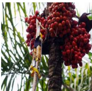
Foto 21, Chonta