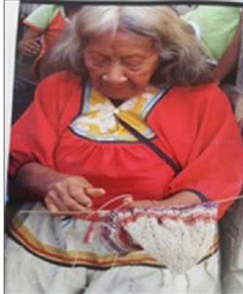
Foto 7, Artesanía elaborando la shigra

Para la elaboración de la Shigra se extrae la fibra de chambira de la palma de coco del monte, se la cocina durante 30 minutos, se lava con jabón y se deja por 3 días en el sol para que se blanquee, cuando este seco se parte la chambira por la mitad y se la tuerce según lo que vaya a utilizar, luego se teje utilizando la latilla de caña brava y también se va pintando la chambira con colores naturales como: rojo, amarillo o verde.