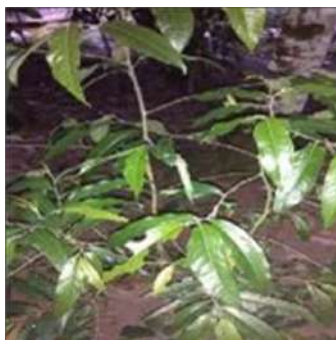
Foto 35, Planta medicinal

Esta planta medicinal sirve para hacer bañar a los bebés recién nacidos que no pueden dormir bien y lloran mucho.