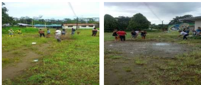
Foto 51, minga de la comunidad