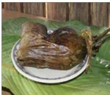
Foto 27, Maito de pescado

El consumo del Maito de pescado para la nacionalidad es muy importante, esta gastronomía es la base en todo evento social, cultural y familiar, se lo sirve con yuca, plátano verde y chucula, bebida a'indekhû-kofanes que se la consumen a diario.