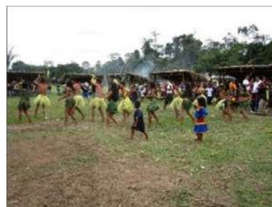
Foto 48, Danza de los Kofanes

La nacionalidad A'i Kofan mantiene la danza autóctona, donde presentan hombres y mujeres con instrumentos típicos de la nacionalidad como: Flauta, tambor y bífano.