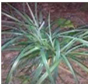
Foto 71, Planta de Kanukhuechu

Esta planta es un secreto para las abuelitas, cuando no llueve y están sin agua toda la familia de una comunidad, ellas recogen el tallo de kanukhuechu y van al río lo machacan y lo votan al río soplando diciendo que llueva.