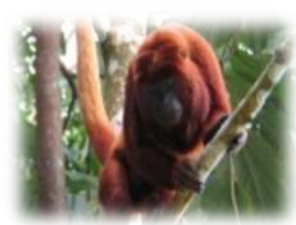
Foto 60, Animal salvaje

Soñar que un mono aulla significa que va morir un familiar lejano o un vecino.