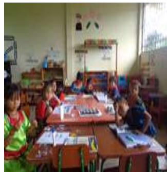
Foto 86, Niños realizando juegos tradicionales en las instituciones educativas

En las instituciones educativas de la nacionalidad A'í,Kofan se practica el inter aprendizaje primero en la lengua materna que es el a'ingae y en español como lengua de interrelación, utilizando siempre la vestimenta propia. Muchas de las actividades que se realizan dentro la educación son con identidad propia de la nacionalidad, inculcando a los niños desde muy temprana edad, sobre el valor que tienen nuestras vivencias culturales rutinarias dentro de las comunidades.