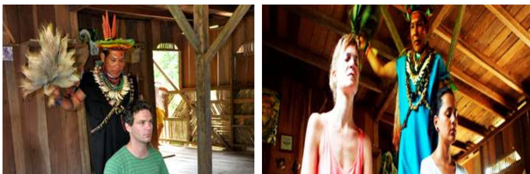
Foto 70, El sabio curando al enfermo

Nuestros ancestros para la curación utilizaban las plantas y hierbas de la localidad como medicinas naturales, que para nosotros la población de la nacionalidad Kofan la selva es como una farmacia para curar de cualquier enfermedad. Y en la actualidad siguen utilizando esta medicina natural pero van combinando con la medicina occidental. A más de esto para las familias de escasos recursos económicos aún sigue utilizando las plantas y hierbas como medicina para curar a sus miembros y los shanames también interviene en las curaciones de cualquier enfermedad como es mal viento, susto y entre otros.