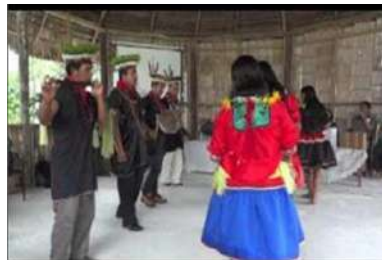
Foto 47, Danza de los Kofanes

La nacionalidad A'i Kofan mantiene la danza autóctona, donde presentan hombres y mujeres con instrumentos típicos de la nacionalidad como: Flauta, tambor y bífano.