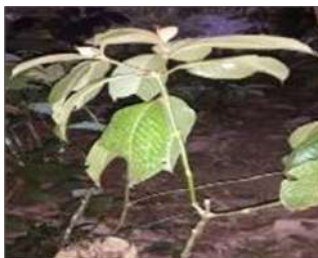
Foto 34, Planta medicinal

Primeramente extraer las hojas y la raíz de surefa luego se machaca y se pone a cocinar en una olla durante 30 minutos, después la persona que esta con el dolor hay que coger el agua caliente en un vaso y enjuagar 4 veces al día.