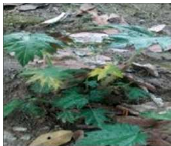
Planta 39, Ortiga/ planta medicinal

Se recoge las hojas y la raíz de kenene, luego machacar los dos juntos y cocinar, tomar en un vaso todos los días hasta que calme el dolor.