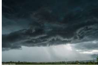
Foto 84, Nube negra

Cuando en el día, las nubes se ven oscuras nos da la señal que va a llover de día.