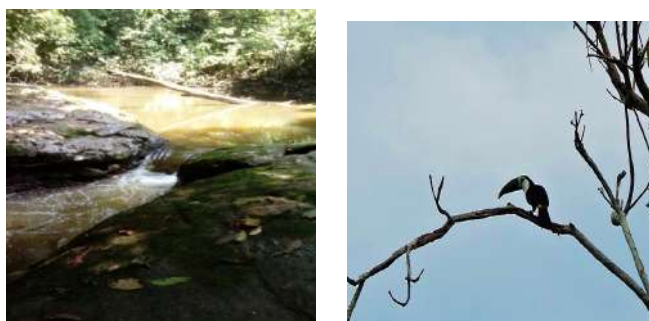
Foto 43, Naturaleza viva