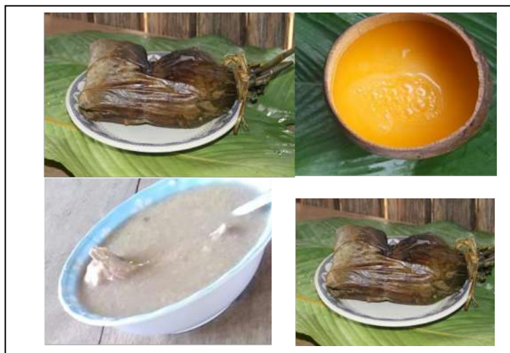
Foto 26, Platos típicos