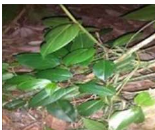
Foto 33, Planta medicinal

Primeramente hay que recoger las hojas de tûsindi y luego se machaca y se pone a cocinar en una olla durante 30 minutos, después se saca la olla y la persona que esta con dolor hay que tapar con una toalla hacia la olla para recibir el vapor o también se hace paños con ese agua de medicina unos 5 veces al día.