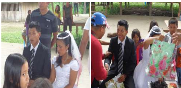
Foto 50, Matrimonio actual de la nacionalidad Kofan