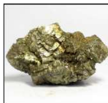
Foto 58, Piedra de oro

Soñar recogiendo oro significa que el mismo se va a morir.