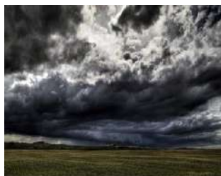
Foto 75, Nube

Cuando el cielo está oscuro y existe la presencia de una niebla azulada, indica que habrá tremenda lluvias.