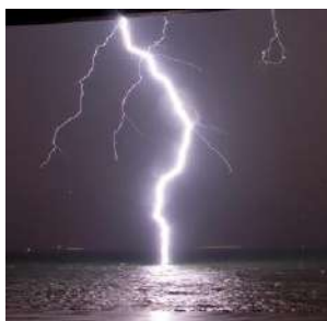
Foto 76, Rayo sobre el río

Los abuelos y abuelas nos indican que cuando un rayo cae sobre el río es porque los pescados se encuentran en ese lugar que cayó el rayo.