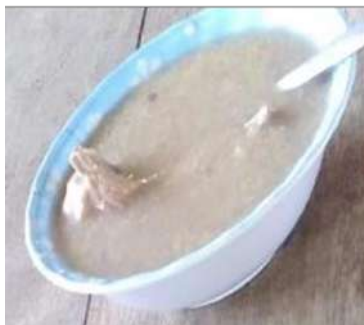
Foto 28, Mazamorra con guanta

Es un plato típico muy deseado dentro de la nacionalidad, este plato se ha venido consumiendo de generación en generación por las familias de las comunidades.