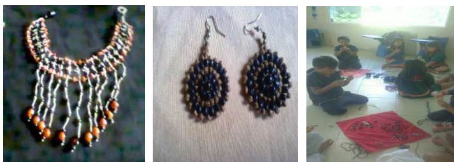
Foto 88, Exposición de artesanías elaborado por los niños

Fomentar a través de estas actividades educativas el uso de las semillas del campo, la elaboración de collares, aretes y otros de los saberes ancestrales de nuestros sabios, que permita una educación más activa, participativa y dinámica dentro del proceso de enseñanza-aprendizaje que con lleven a un mejoramiento en los diferentes ritmos y tipos de aprendizaje en nuestros educandos, docentes y comunidad educativa.