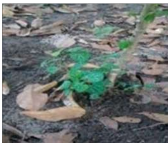
Foto 38, Planta medicinal

Las hojas de útûfasi se machaca, se recoge en un recipiente se mezcla con una pequeñas gotas de agua y se los toma sin cocinar.