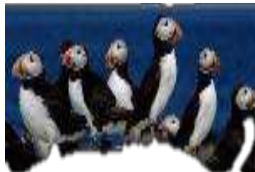
Foto 79, Ave silvestre

Si estos pájaros trinan en la mañana: tiva,tiva,tiva, da la señal que el rio aguarico (principal rio de la comunidad) va secar.