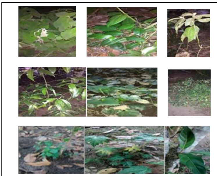
Foto 31, Plantas de la localidad