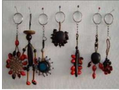
Foto 10, Llaveros de semillas