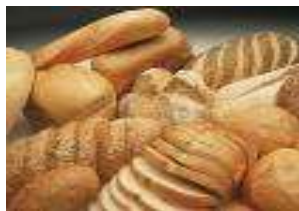
Foto 62, Pan

Soñar que uno está comiendo arto pan, significa que su esposo va ir de casería y va casar artos animales para el consumo familiar.