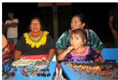
Foto 41, Venta de artesanías y tejidos