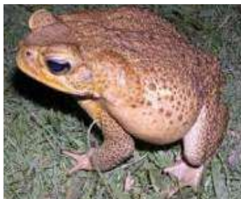
Foto 81, Sapo turumba

Si estos sapos llamados Turumba trinan bu, bu, bu por la noche, es señal que al siguiente día va ser soleado.