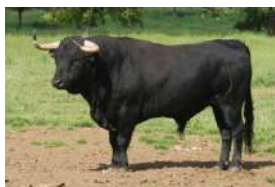
Foto 54, Toro

Sñar con uno o varios toros, significa que va tener visita de personas en su casa.