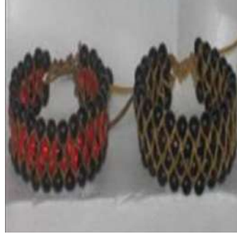
Foto 5, Manilla de semillas