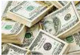
Foto 56, Fajos de dinero

Soñar que uno está recibiendo arto dinero, significa que va recibir comentario o mentiras.