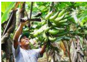
Foto 19, Cosecha de plátano verde

Al año los plátanos verdes están listos para la cosecha y consumo familiar, y también se puede preparar de diferentes maneras para el consumo.