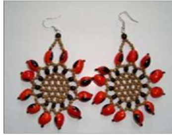
Foto 9, Aretes de semilla