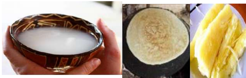
Foto 16, Chicha de yuca