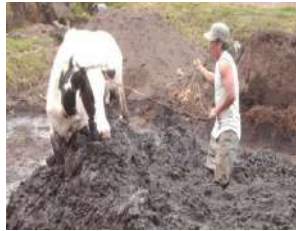
Foto 59, Lodo

Soñar que le tiren lodo en el cuerpo significa que el mismo se va a morir.