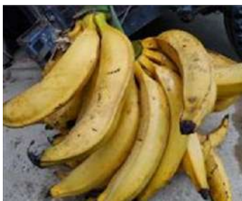
Foto 20, Maduro

Al año los plátanos verdes están listos para la cosecha y consumo familiar, y también se puede preparar de diferentes maneras para el consumo.