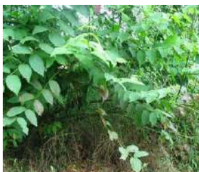
Foto 83, planta de la comunidad Kofan

Cuando una persona se va de casería y se encuentra a una planta tapado en un camino nos da la señal que por allí no hay que pasar, es peligroso si pasas por de abajo vas a enfermar.