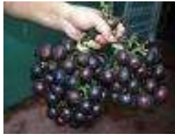
Foto 55, Fruta silvestre

Soñar chupando uvas con las familias, significa que va llorar cuando muere alguien de la familia.