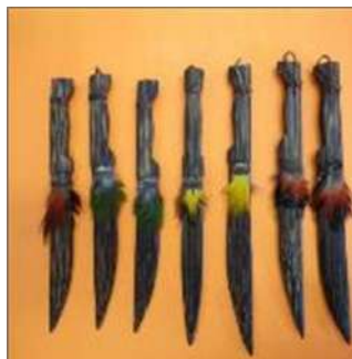
Foto 11, Cuchillo de pambil