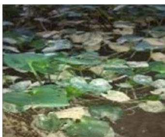
Foto 36, Planta medicinal

Esta planta medicinal sirve para el dolor del estómago, esta medicina solamente se encuentra en lugares pantanosos.