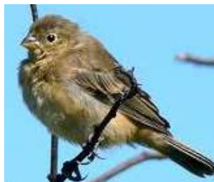
Foto 80, Ave silvestre de la localidad

Si estos pájaros llamados vishiru, vishiru trinan cuando se va de pesca o de casería, da la señal que te va ir bien en la casa o pesca.