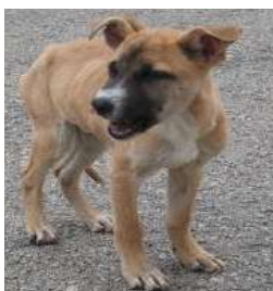
Foto 82, Perro de casa

Cuando los perros lloran de noche nos da la señal que va morir una persona de la casa.