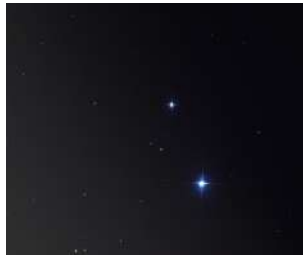
Foto 85, Estrellas en las noches