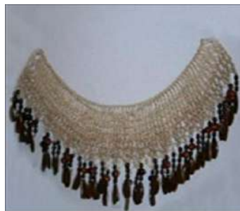
Foto 4, Pechera