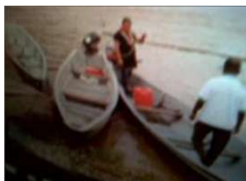
Foto 42, canoas de venta

En la nacionalidad A'Í Cofàn el medio de transporte es fluvial, por ello existen maestros en la construcción de canoas de fibra. Estas canoas son fabricadas por la misma gente de la comunidad para poder movilizar a la familia. Las canoas que se elaboran son de