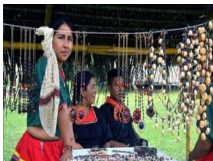
Foto 1: Exposición de artesanías elaboradas a base de semillas de la selva.

Las actividades productivas y económicas de la nacionalidad a'i kofán se basa en la horticultura itinerante; las chacras familiares son combinados con productos como: cacao, café, maíz para la venta en menor grado; plátano, yuca, árboles frutales nativos como guaba, caimito, chontaduro, uvas y maní de monte para el consumo familiar, estas chacras están al cuidado de la familia. Una parte del ingreso de la economía en las familias de la nacionalidad a'i kofan, depende de la elaboración de las artesanías, que son hechas a base de semillas naturales y fibra de chambira recolectados de la selva y las mujeres lo realizan en sus tiempos libres.