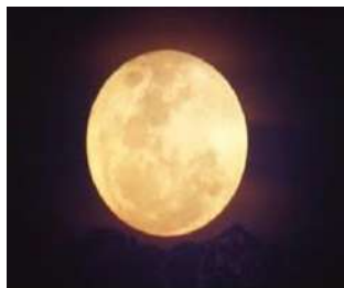
Foto 74, Luna llena

Para los a'indekhû, la luna es considerada mujer, es por eso que se dice khuvû kûjechu'chu en estos días se puede realizar cualquier sembrío de productos por que da buena cosecha, se construye canoa, se construye casa de paja porque dura más.