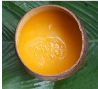
Foto 29, Chicha preparada

Luego de tener listas las presas de guanta se pone a hervir en el agua con todos los condimentos al gusto y cuando ya esté cocinándose se le pone el rayado de plátano verde para que vaya espesándose y haciéndose una sopa.