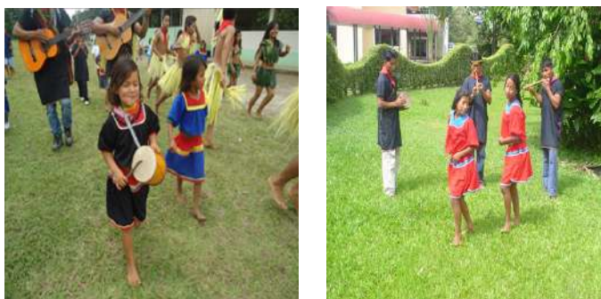
Foto 44, Niños haciendo danza y música

La nacionalidad A'i, tiene y practica sus propias vivencias socio culturales como: danza, música, ritualidades y celebraciones de algunas fiestas propias de la nacionalidad, ellos lo