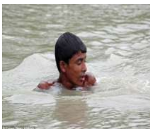
Foto 63, río

Soñar que uno está bañando en el río significa que va dar fiebre.