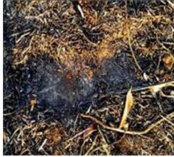
Foto 13, Terreno en proceso de preparación

Para una buena siembra de yuca, primeramente se socla el área que se va a utilizar para la siembra, se quema las malezas y los residuos se bota, esta actividad se puede realizar en cualquier época del año.