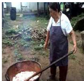
Foto 65, Hombre cocinando

Soñar que uno está friendo manteca de chanco significa, que le va a pegar gripa.