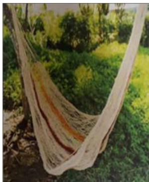
Foto 8, Hamaca colgada

La shigra se la utiliza como una funda para recolectar frutos, en la caza y pesca, o cargar cualquier otro producto. Esta artesanía para la elaboración es muy laboriosa se lo termina en dos días de trabajo.