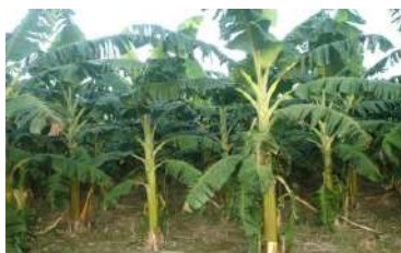
Foto 18, Cementera de plato

Para el buen desarrollo de las plantas se debe realizar la limpieza del área cada 4 o 5 meses. Esto con el fin de tener buenos frutos al momento de la cosecha.