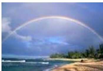
Foto 77, Arco iris

Los abuelos y las abuelitas indican que cuando sale un arco iris a la orilla del río está la boa en ese lugar. También nos explica que es prohibido indicar con el dedo al arco iris, porque si indicas se puede podrir el dedo.