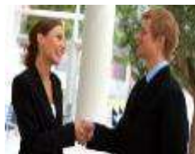
Foto 61, Pareja

Soñar que está saludando, significa que él papá va ir de casería pero no va casar animales.