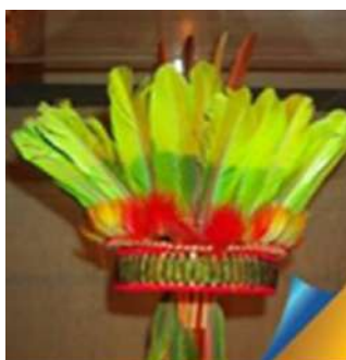
Foto 3, Corona de pluma

Este collar es parte de la vestimenta de la nacionalidad y lo utilizan de adorno tanto los hombres como las mujeres y en la actualidad esta artesanía está siendo comercializada. Corona de plumas