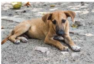
Foto 66, Perro de casa

Si un perro llora de día y noche es que va morir su padre o madre o si no el vecino.