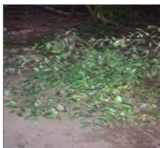
Foto 37, Planta medicinal