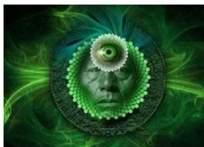
Foto 53, Imagen que aparece en el ritual del yaje

Los sueños nos permiten tener una aproximación de lo que puede pasar en el diario vivir.