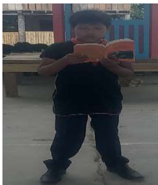
Foto 90, día de la lengua materna

SUBSECRETARÍA DE EDUCACIÓN INTERCULTURAL BILINGÜE