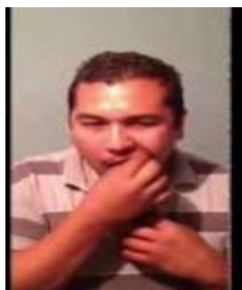
Foto 64, Hombre sacándose las muelas

Soñar que uno está sacando la muela significa que va morir un familiar lejano o un vecino.