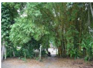
Foto 73, Naturaleza

En el mundo de la nacionalidad A'í Kofan hay distintas señales que manifiesta la naturaleza, y de acuerdo a esas señales se planifica para realizar o no realizar las diferentes actividades.