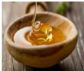
Foto 57, Taza con miel

Soñar lamiendo la miel significa que van a llorar por la muerte de algún familiar.