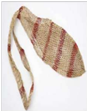
Foto 6, Shigra

Estas manillas las utilizan todas las personas: hombres, mujeres y niños. En estos últimos tiempos se la comercializa en las ciudades cercanas.