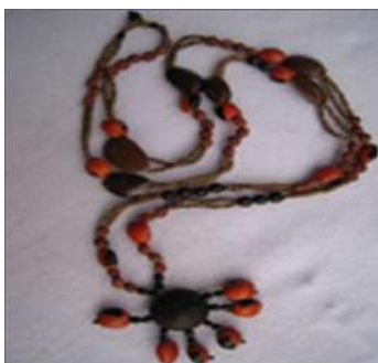
Foto 2, Collar