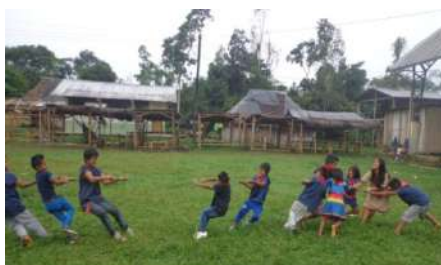
Foto 89, juegos tradicionales

Los estudiantes deben saber y aprender los diferentes tipos de juegos como son; tradicionales de la comunidad: lanzamientos de lanzas, jalada de sogas etc.