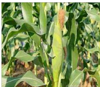
Foto 22, planta de maíz