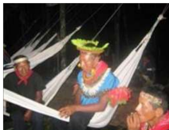
Foto 52, Sabio de la comunidad Dureno