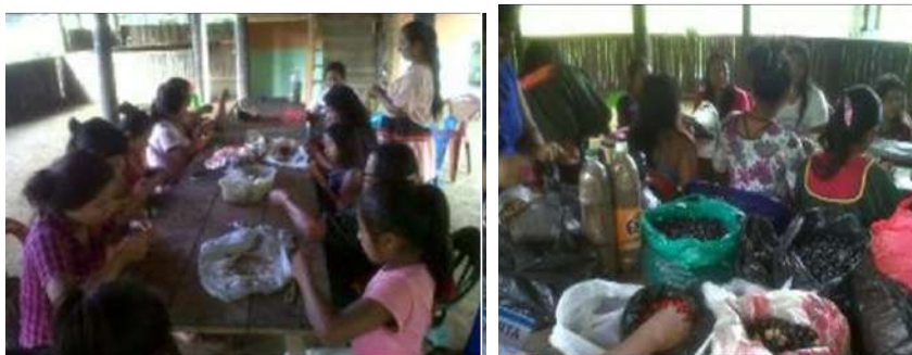
Foto 87, Elaboración de Artesanías con Semillas del Campo por los niños

Fomentar a través de estas actividades educativas el uso de las semillas del campo, la elaboración de collares, aretes y otros de los saberes ancestrales de nuestros sabios, que permita una educación más activa, participativa y dinámica dentro del proceso de enseñanza-aprendizaje que con lleven a un mejoramiento en los diferentes ritmos y tipos de aprendizaje en nuestros educandos, docentes y comunidad educativa.